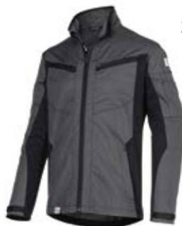
Schwarz | Anthrazit 1230 5370-9997 XS-4XL