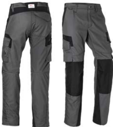
Anthrazit | Schwarz 2230 5370-9799 40-66, 90-118, 25-31