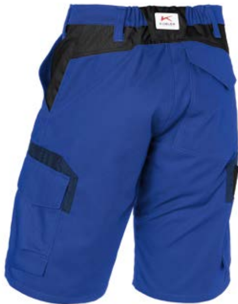
Kbl.blau | Schwarz 2430 5370-4699 44-66