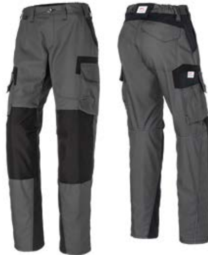
Anthrazit | Schwarz 2530 5370-9799 D34-D54