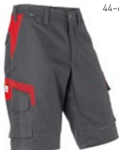
Anthrazit | Schwarz 2430 5370-9799 44-66