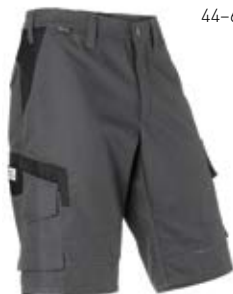
Schwarz | Anthrazit 2430 5370-9997 44-66